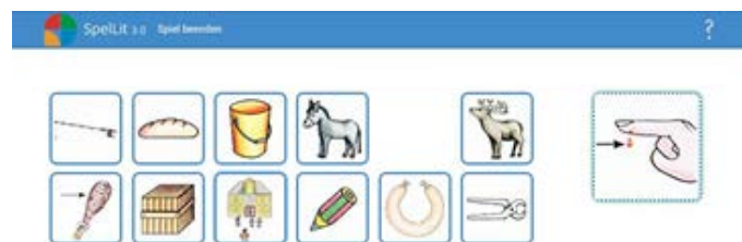
Abbildung 2: Gemeinsame Wahl von Begriffen

Anders als bei SpellLit der zweiten Generation werden für SpellLit 3.0 Geräte verwendet, die über Webbrowser und Internetverbindung verfügen. Dies sind beispielsweise Smartphones, Phablets, kleine oder normale Tablets, Laptops, PCs oder aber auch Multitouch-Bildschirme. Es werden immer zwei Geräte mehr benötigt als Spieler teilnehmen. Spielen vier Kinder, so benötigen sie sechs Geräte. Die vier Geräte, die jeweils einem Kind zugeordnet sind, sollten leicht trag- und bedienbar sein. Das Lernspiel besteht aus vier zeitlichen Phasen. Der Einrichtung eines Spiels sowie drei Spielphasen, die sich in jeder folgenden Spielrunde wiederholen: gemeinsame Auswahl eines Begriffs , gemeinsame Auswahl der Laute und gemeinsame Übergabe und Auswertung der Laute . Über ein Start-Icon wird SpellLit gestartet. Die Lehrkraft wählt „Spiel erstellen“ auf dem Home-Screen und richtet das Spiel für die Kinder ein. Nun können die Kinder auf ihrem Startbildschirm per Klick dem Spiel beitreten. Das Spiel beginnt für sie, indem sie sich gemeinsam ein Wort aussuchen, das durch ein Bild repräsentiert und bei Berührung eines Bildes vorgelesen wird (Abb. 1).