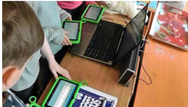
Abbildung 5: Kinder reihen sich auf und übergeben nacheinander jeweils ihren Laut an das Zielgerät.

Auf dem gemeinsamen Gerät erscheint das geschriebene Wort und es wird den Kindern vom System gesagt, ob ein Fehler vorliegt oder nicht. Sind Laute nur in der Reihenfolge vertauscht, werden diese gelb umrandet und es kann gleich versucht werden, die Reihenfolge zu berichtigen. Erscheint aber ein falsch gewählter Laut, wird dieser rot umrandet (Abb. 5) und die Kinder müssen zurück zum anderen gemeinsam verwendeten Gerät, um ihr Gerät erneut freizuschalten und gemeinsam zu überlegen, welchen Laut sie stattdessen aussuchen müssen. Ist das Wort richtig geschrieben, wird es vorgelesen und ein Lob ausgesprochen.